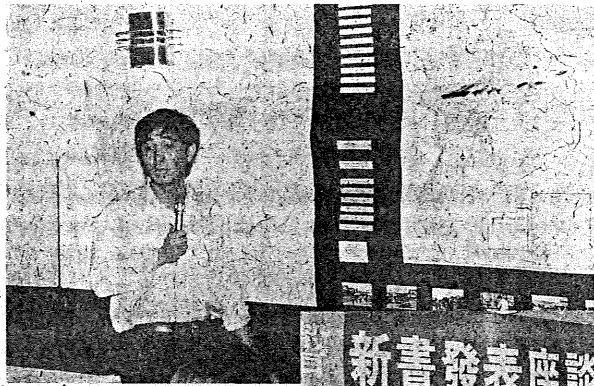
支對長團團務服泰中 介簡一作務服民難接