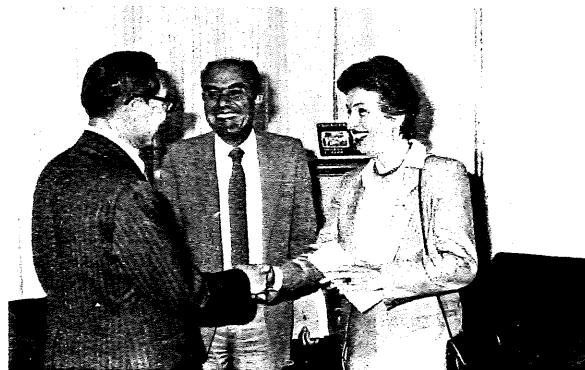
歐洲理事會副秘書長阿迪諾菲拜會本會

理事會副秘書長阿迪諾菲於五月二十日拜會本會。阿迪諾菲與本會理事會成員就歐洲與我國在國際人權組織合作、密切聯繫及交換彼此之出版資料，為維護人權而努力。阿迪諾菲表示，雖然必須防止類似高棉事件和王承先等事件的再發生，以達到政治和平、人權伸張的真正目的。中華民族的刑罰、軍事審判的公開發布和不斷改進。