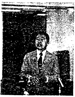
· 明 驥 先 生 ·

當然，看大陸大字報等地下出版品問題，決不如此簡單。因爲大字報與地下出版物是匪區高階層路線鬪爭的手段之一。例如在文革初期，林彪、江青集團說王光美是特務，說陳毅、許世友反對「主席」，說「文化部」全爛了。：風一放出去，打手就四出打、搶、砸、抄。而另一派系也放出風聲：這個幹部自殺了，那個幹部病死了，以迷惑和藏匿打手們的目的。至於傳播機被匪管當局控制著，無中生有，顛倒黑白，人們對報刊又如何能相信呢？ 因此，大陸大字報與地下出版品之風起雲湧，給我們以無限慨嘆，我個人願在此表示簡單的三點看法：