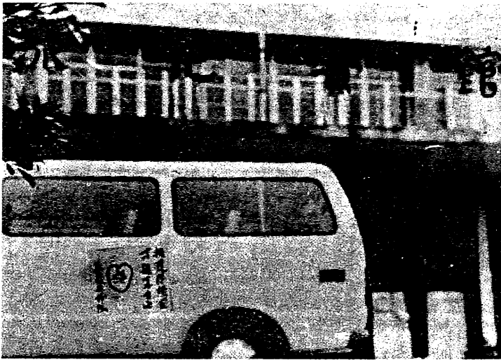
大陸反共組織「正義先鋒隊」最近在廣州市流花湖區「流花賓館」門前，將「擁護蔣經國，才能享自由」及「決心倒鄧」等標語、標誌，張貼在匪的一輛旅行車上。

【本刊訊】中國人權協會於四月十一日對大陸希望並向自由世界呼籲，要求中共本人道立場及人權之精神，迅即釋放傅月華、任萬定、魏京生等所有遭逮捕之人士，與民主運動人士， 並擬發動邀請在大陸最早鼓吹人權運動之先驅李一哲等至中華民國訪問，將自由中國人權與中國大陸人權作一客觀比較。 中國人權協會鑒於中共自三月底起採取高壓手段，開始抑制大陸人民爭 取人權與自由民主之澎湃浪潮，特於四月十一日舉行「中國大陸人權運動」研討會，聲援大陸同胞繼續為爭取基本人權奮鬥。 這項研討會決定籲請全世界自由國家及國際組織，密切注視中國大陸人