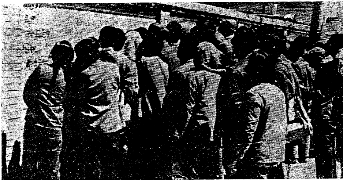
去年十一月大字報風潮初起之時，北平西單「民主牆」貼出批吳德的大字報，而今吳德未倒，「民主牆」已瓦解冰消。