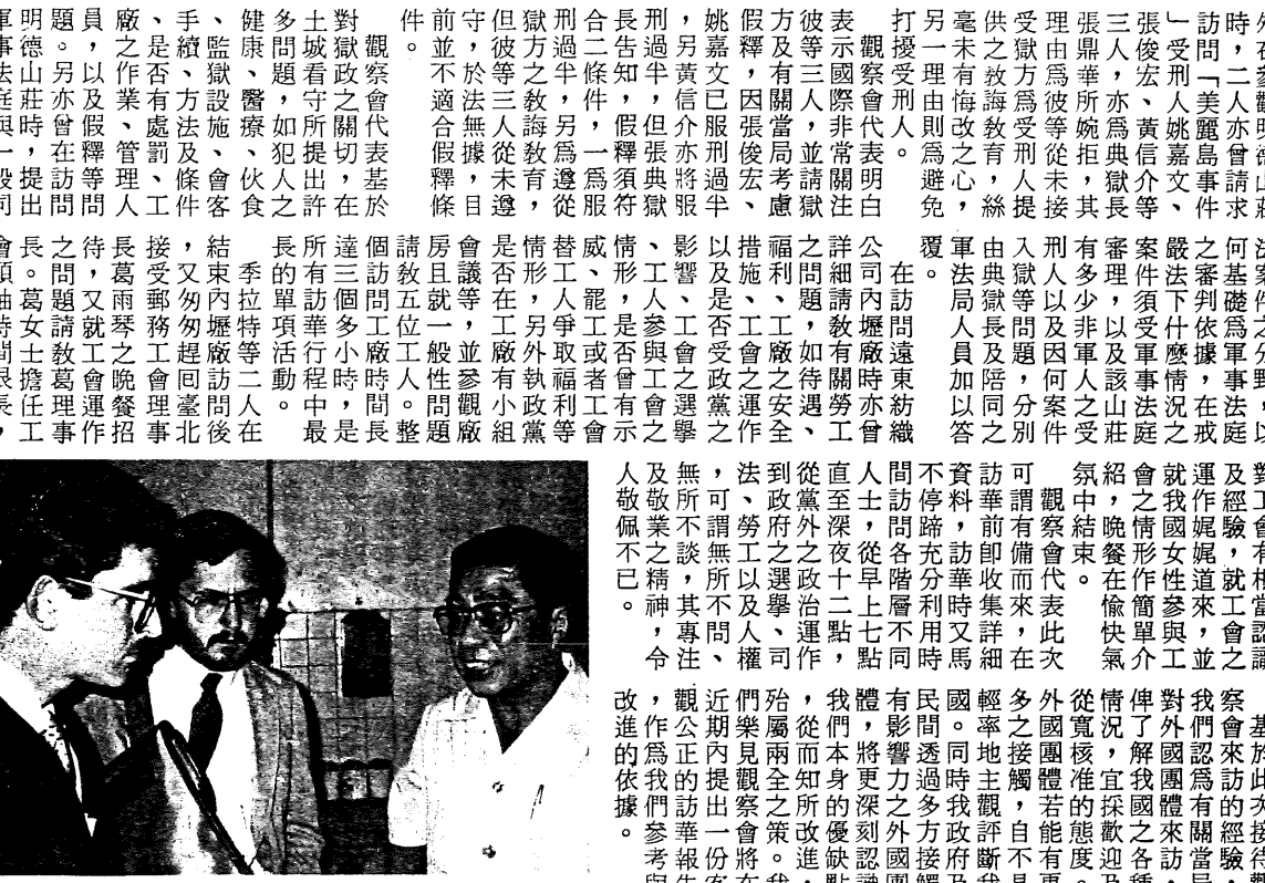
亞洲觀察會代表訪台北看守所