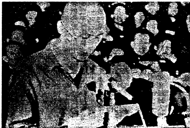
今年十月十六日人權鬥士魏京生在中共「北京市中級人民法院」受審的情形。

堅持」（堅持社會主義道路，堅持無產階級專政，堅持共產黨領導，堅持馬列主義、毛澤東思想），用以大力鎮壓民主運動。身爲民主運動靈魂人物的魏京生首當其衝，於今年三月廿九日遭到中共非法審判，並於今年十月十六日在中共非法審判下，被判處十五年的徒刑。雖然魏京生被中共判處十五年的徒刑，但是我們深信，「魏京生思想」必然會發揚光大於中國大陸，「魏京生精神」決不會因爲魏京生遭到中共的囚禁而有任何損傷，可以逆料的是「魏京生精神」的力量可能因爲「暫時力量對比懸殊，而不能馬上顯示出來，但歷史將證明它的力量是無敵的。」 即使在中共「四個堅持」的箝制下，我們堅信，今後必將有千千萬萬的魏京生湧現在中國大陸上，獻身於爭民主、爭人權運動。