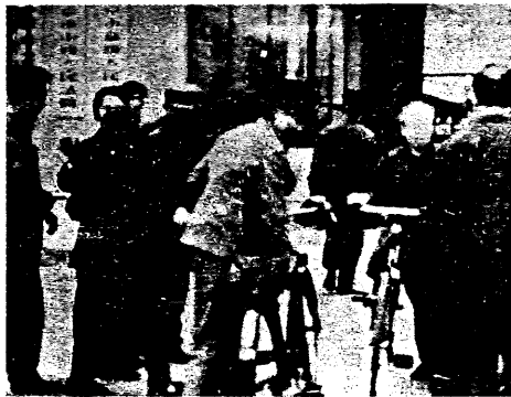
北平民衆集法院門外關切魏京生受審。

【本刊訊】舉世聞名的大陸人權先驅、民主戰士、前「北京市公園服務管理處」工人魏京生於十月十六日，在「北京市中級人民法院」接受審判。魏京生被中共當局控告兩項罪名，一是向外國人供給中共軍事情報；二是公開煽動推翻中共無產階級專政的政權和社會主義制度，在「反革命」罪名下，魏被判處十五年徒刑，刑滿後剝奪政治權利三年。而魏京生主辦的「探索」雜誌也被中共當局指責為「反動刊物」。 魏京生現年廿九歲，是一位自小吃「共黨奶水」長大的大陸知識青年，為什麼會變成一個「反革命」呢？ 據紐約時報記者巴特斐發自北平的報導指出，當魏京生僅僅十二歲時，他的父親即要他背誦毛澤東的著作。他的父親出身卑微，後來一直升到「國家建設委員會」擔任一副主管「級的高幹，因而篤信「毛澤東思想」。魏京生每天必須背一篇「毛語錄」，否則不准吃飯。他的母親也是共黨幹部，用的方法比較溫和。她告訴魏京生，她在一九四九年以前的遭遇，要他相信只有中共會幫助窮人及「被壓迫者」。 照常理來說，魏京生出身於一個標準的「共黨家庭」，其階級成分屬於百分之百的「紅五類」。由巴特斐的報導可知，魏京生從小時候開始，他的父母即刻意塑造他成爲一個堅決捍衛「毛澤東思想」的信徒；但是魏京生爲什麼成爲一個打倒「毛澤東思想」的叛徒呢？此一問題實耐人尋思。 也許，巴特斐的報導能够提供此一問