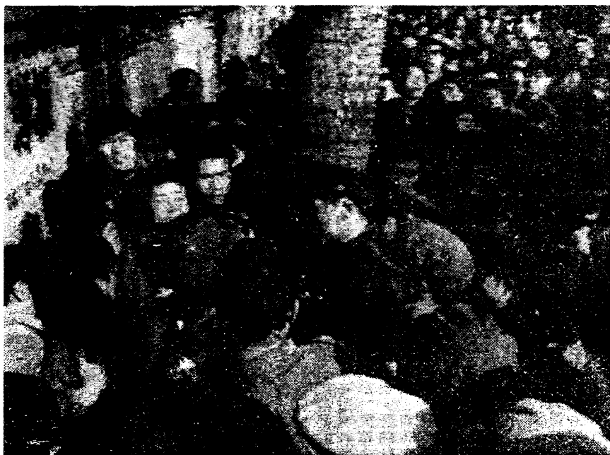
子份動運主民主禁，「牆主民主」平北往前日一十月本察警共中名多百一 主民年青對共中是這，捕被人四有果結，錄紀察受生京魏輯編「索探」書發 。告警厲嚴的子份動運