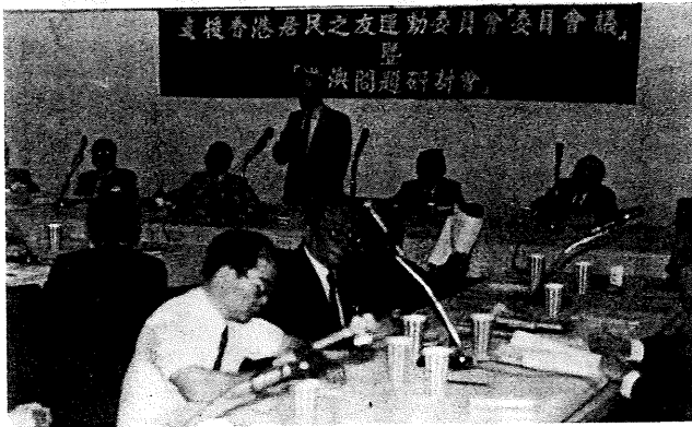
一會討研持主長事理杭一

深表敬佩。相信在海內外共同努力下，對於支持港澳居民維護民主自由及權益的工作，必能有具體的效驗。 港友會祇是一個民間團體，它能夠發生影響，主要因素之一是杭立武博士的熱忱。杭召集人在此次研討會開幕式中，曾說明他個人和香港的關係。早在民國二十三年，他第一次到香港，此後曾多次往來於重慶、香港之間。杭氏時任「中英文教基金會」總幹事，與當時的香港大學校長同委。港督曾禮聘杭氏為港大校務發展委員。抗戰前夕，當時的外交部長郭泰