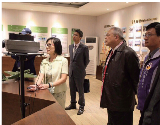
林理事長一行人參觀空軍教準部部史館