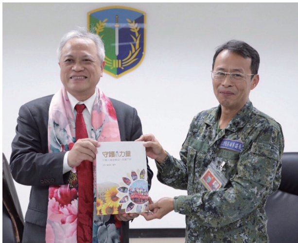
林理事長將本會出版之「守護的力量」乙書致贈副參謀長

參觀完陸軍的生活設施，我們發現軍中人權的實踐，已經從觀念上改變，將官兵生活環境的改善列為優先，其次才是訓練，這的確是「以人為本」的重大進展，非常值得肯定。