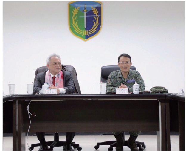
花防部副參謀長接待林理事長等一行人到訪