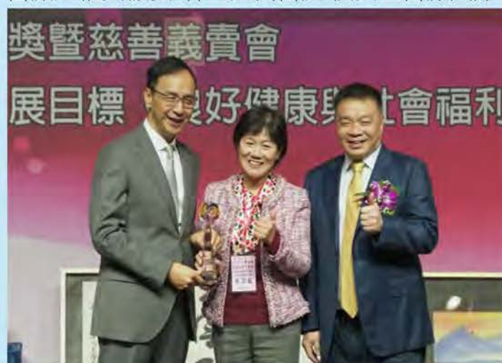
防疫人權貢獻獎-護理師全國聯合會