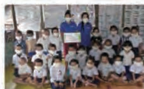
感謝加千實業公司捐贈口罩5000個供泰緬邊境難民幼童使用