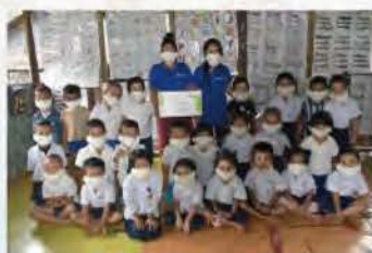
感謝加千實業公司慷慨捐贈口罩 5000個，供泰緬邊境難民幼童使用