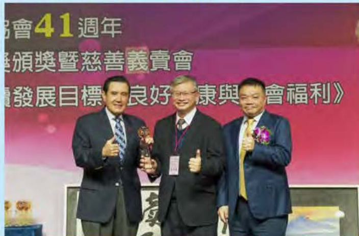
醫療人權貢獻獎-林口長庚醫院 復興區醫療團隊