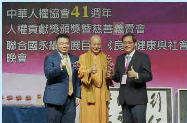
社會服務人權貢獻獎-財團法人安泰醫院