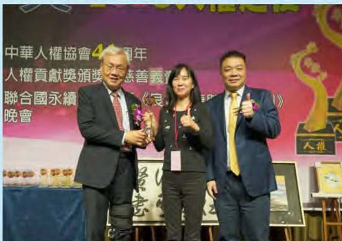
新聞報導人權貢獻獎-Etoday 行動法庭