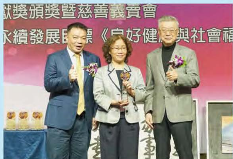
防疫人權貢獻獎-台大醫院 感染管制中心