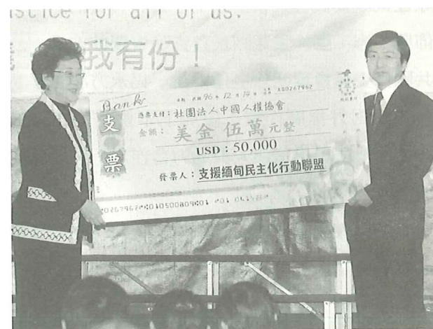
呂秀蓮副總統捐贈本會美金五萬元

呂副總統秀蓮女士致詞期許在中國人權協會及所有人的共同努力下，世界人權能得到更大的彰顯與保障。呂副總統表示：「中國人權協