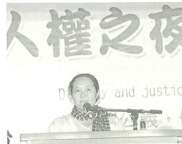
辛西雅醫師蒞臨致詞感謝本會對緬甸難民的陪伴與付出

在國際間享有「緬甸德雷莎」美譽的「梅道診所」創辦人辛西雅醫師，經由本會的推薦提名，獲選為台灣民主基金會「2007 年亞洲民主人權獎」得主。因本會 TOPS 在泰緬邊境所進行緬甸難民人道及教育服務，與「梅道診所」長期合作，關係緊密，奠定深厚友誼，辛西雅醫師特別利用此次難得訪台機會，蒞臨「2007 人權之夜」會場，除上台致詞感謝本會長期對於緬甸難