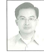
羅爾維 國家衛生研究院助研究員