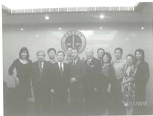
與會者共同合影於中國政法大學

齊主任進一步指出：關於少數民族的部分，我們是根據《憲法》的規章來進行統治，中國近來所發生的事情也讓我們反思，從學理來思考西藏發生的問題、新疆發生的問題。在對於少數民族當中，我們施行的是一種差別待遇、優惠政策，但今天發生的事情都讓我們去反思法律的制度。我們也有派人專門到加拿大研究原住民政策，這個問題無法迴避。在大陸對付的，是新疆的牧民，因為他們擁有個人的資產，是最富有的。雖然生活的質量不高，但個人的財富很高。經濟發展與貧富政策之間到底關係為何？民族平等發展是否有效，這是值得懷疑的。