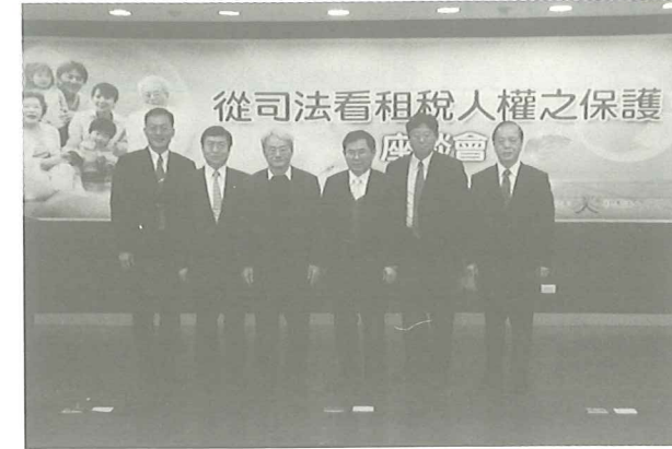
本會舉辦租稅人權座談會，與會者合影留念