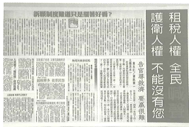
保障納稅者權益，政府責無旁貸

按以所漏稅額之比例，特別是倍數作為裁量基準，係民事罰損害賠償方式，漏稅罰係違反稅法金錢給付義務之公法上制裁，並非損害賠償之估算，故不僅行為罰不得按所漏稅額處罰，漏稅罰所漏之稅本應補稅追繳，處罰部分旨在其違反量能平等負擔，破壞自由市場競爭秩序之制裁，非重在國庫收入，亦與所漏稅額倍數(可能影響輕重之裁量，但非倍數)無關，係制裁行為人，而非填補所受損失、所失利益或推估之損失(所漏稅額倍數)，嚴重者應處以徒刑，亦不宜以過重倍數罰鍰影響個人及其家庭與企業之生存，故漏稅罰罰鍰亦宜有上限。按以人性尊嚴為《憲法》核心國家，國家係為人民而存在，國家僅具補充性，國家應留給人民生存發展所需之財產與自由，為課稅權所不能及。特別先有營利事業，才有營利事業所得稅，漏稅之處罰如無上限，往往導致自然人破產，營利事業倒閉，侵害生存保障之核心領域。同樣《民法》上債之履行輔佐人或僱用人責任(《民法》第224條)，此種損害賠償責任亦不宜移植至稅捐罰。