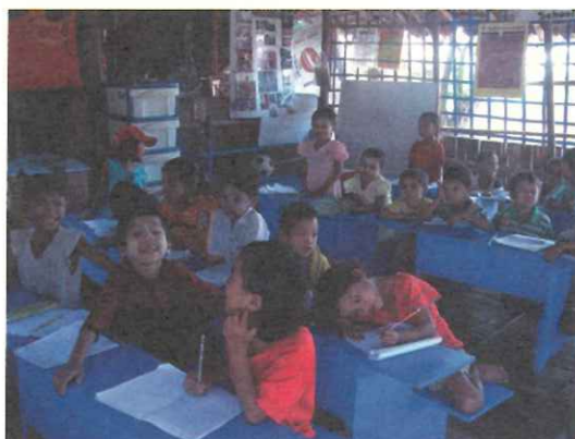
儘管環境未臻理想，但是孩子們仍為難得的學習機會感到滿足與喜悅。