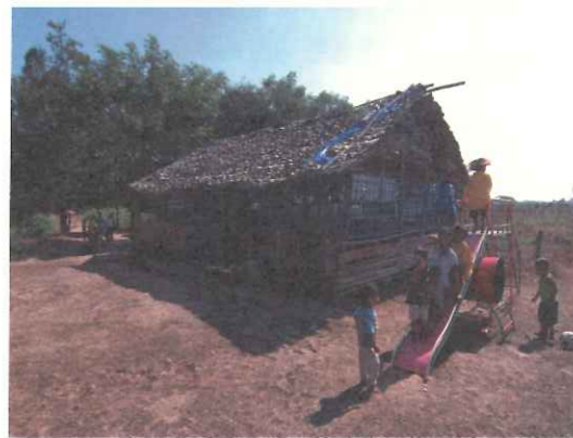
小小的學校，座落在空曠的田野之中。