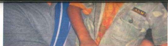
抱著瘦弱的甲良孩童，他無辜的雙眼，更加令人憐惜。

在泰國的最後一天，與樹盛到曼谷的英國外僑俱樂部，參加泰境難民服務協調委員會八月份會議，這個委員會是聯合國難民署整合下形成的，每月舉行一次例行會議。各國的非營利組織