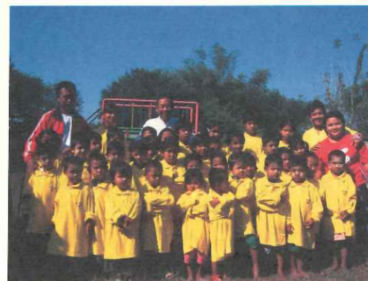
早安小學校的孩子們與老師。

TOPS自兩年前開始了緬甸小學校的訪視活動進行，到現在計畫性的支持其中的10所緬甸貧童小學校。但面對著其他眾多的貧童小學校，我們仍舊盡力提供活動或學習文具用品，以及教師們更多的教學新知與刺激。