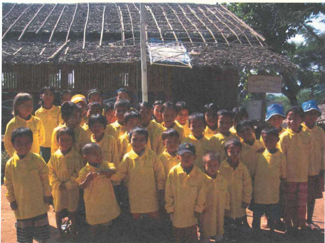
Maw Taw Lu 小學校的孩子們，穿上身上仍過大的捐贈衣物，不僅溫暖了他們的身軀更溫暖了他們小小的心靈。