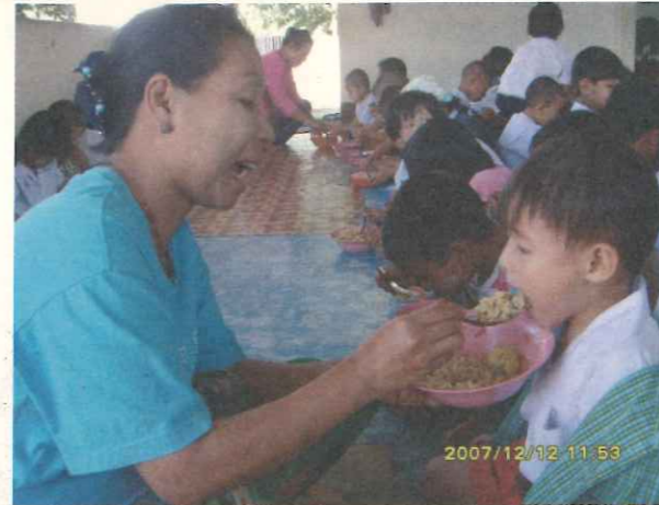
緬甸貧童教育計畫，Parami學校的幼兒營養午餐。

* 由於Prahita學校為新創辦之緬甸社區小學，TOPS提供生活與學習用品，例如黑板、湯匙、餐盤、草蓆、清潔用品、牙膏、牙刷、鉛筆、白板以及筆，同時也提供3000泰銖補充營養午餐之營養。