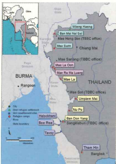
泰國境內存在10座大小不一的難民營，共收容逾16萬緬甸難民。

*發展遲緩兒童之教育—與美國教育組織World Education、法國Handicap International、日本SVA合作，提供適合發展遲緩兒童的教學方式，讓更多兒童能在既有之幼兒園內成長學習。