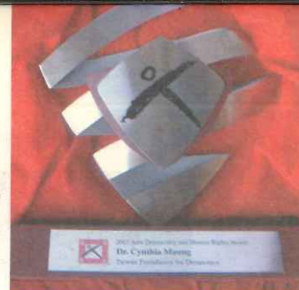
台灣民主基金會頒發辛西雅醫師「2007年亞洲民主人權獎」獎座。

◎ 2007年經由中國人權協會提名，獲頒台灣民主基金會「2007年亞洲民主人權獎」。