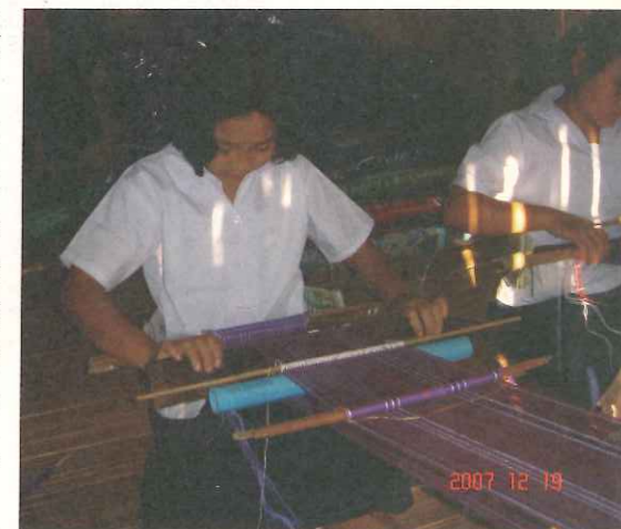
TOPS鼓勵部落學生學習並發揚民族文化與技藝。

透過跨組織與機構的合作，可將更多資源導入偏遠部落的援助發展工作。TOPS與泰國公立學校合作密切，並透過教育局的不斷對話，期盼能影響公部門資源得以更合理地分配在偏遠地區。TOPS也與World Education和 ZOA refugee service等國際非政府組織合作推動各項社區發展事務，並扮演著偏遠鄉村與外界部門之間的「資源協調者」角色。此外，更長期與當地組織——達省邊境兒童協助基金會