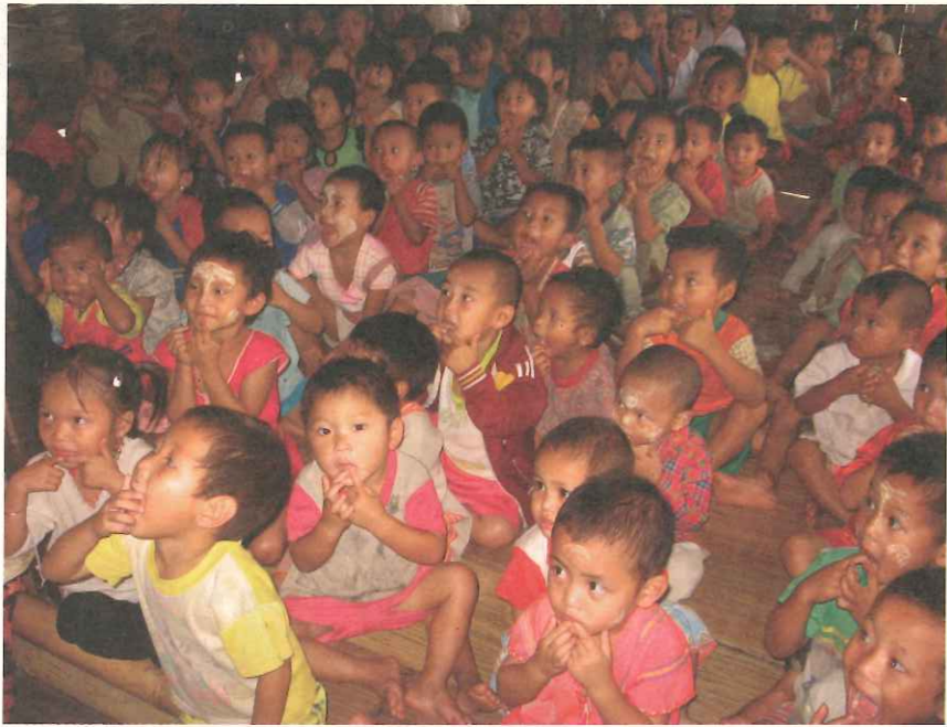
每每看見營內這麼多小朋友依賴TOPS提供上學機會，就讓我們感到身負重任。

如強迫勞務付出、強迫遷村與管制行動自由、打壓各民族文化與宗教信仰等，致使16萬餘難民被迫離開家園，湧入泰國境內尋求基本生存權的庇護。至今，這些少數