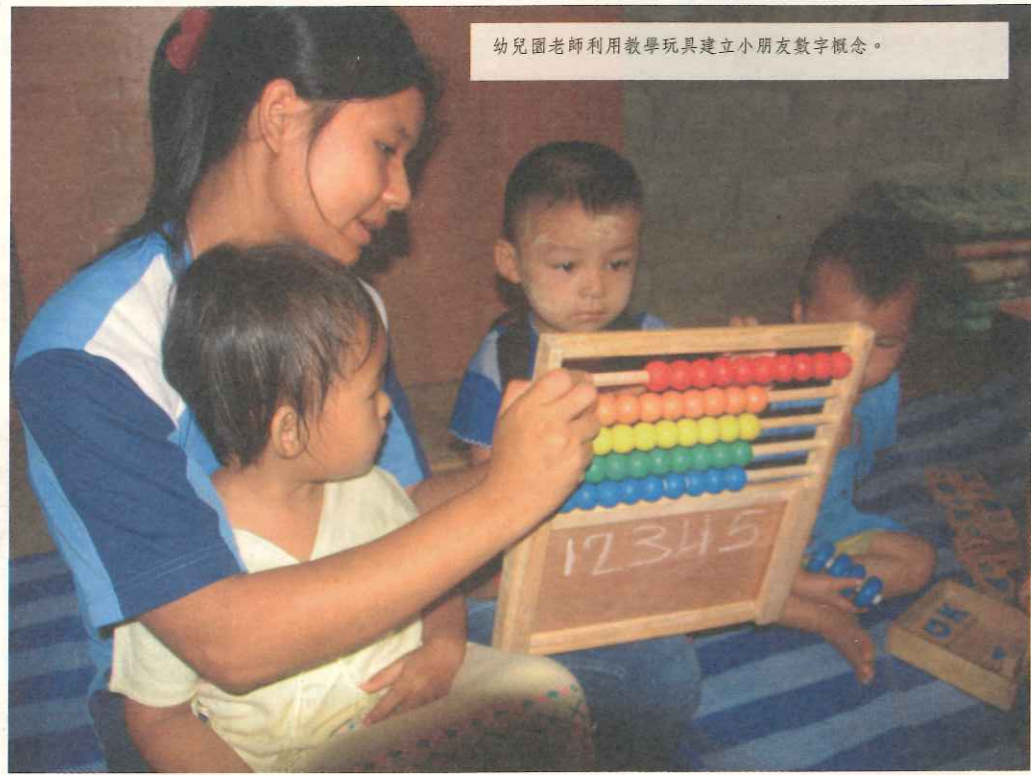
幼兒園老師利用教學玩具建立小朋友數字概念。

之紀錄資料。本次會議共有兩名TOPS工作人員、四名訓練員、兩名KWO工作人員與兩名學校委員會委員參與。