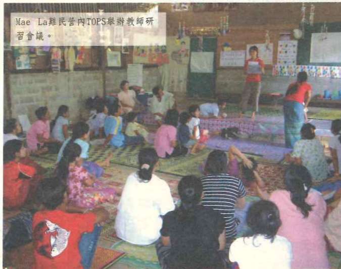
Mae La 難民營內TOPS舉辦教師研習會議。