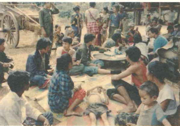
「梅道診所」在創立初期只是簡陋的中途醫療站。

品。面對著大批難民同胞前來避難，即使沒有消毒器材，沒有足夠的醫療設備，沒有充沛的食物和飲水，辛西雅醫生也在極端刻苦的環境下，憑著過人的毅力和堅定的決心，撐起診所的醫療工作，照顧源源不絕的難民們，直到了今天。因此，在現在緬甸人民的口中，所謂的「梅道診所」，緬語的涵義即為「醫學生的診所」。