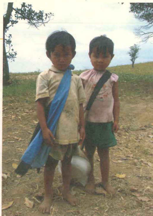
部落小朋友光著腳丫子跋涉也不減上學的熱誠。

據實際需求評估後，並配合TOPS工作人員與教師，進行相關指導與規劃服務行動方案，除了捐贈硬體給適當之在地團體與偏遠學校，更持續舉辦相關營隊活動，提供資訊教育等訓練課程，派遣工作人員定期至各校協助資訊教學，同時協助開發製作相關數