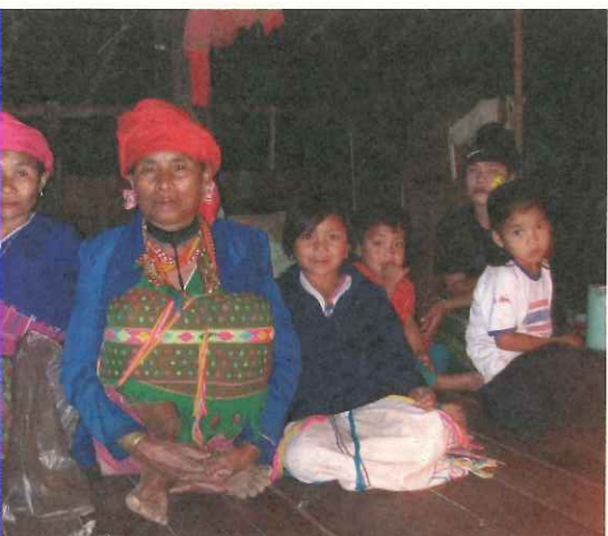
TOPS與KWO合作，持續為難民營內老弱族群提供社會性照護與服務。