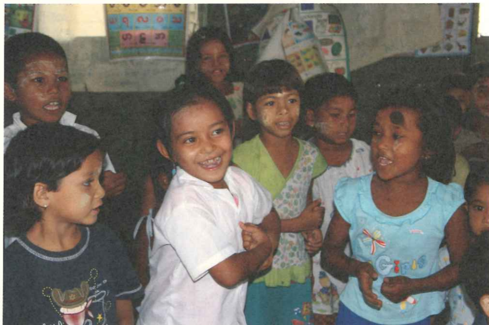
TOPS努力為緬甸移工子女創造快樂的學習環境。