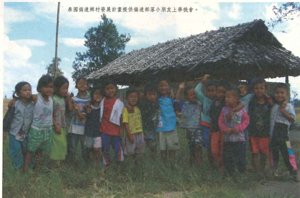
泰國偏遠鄉村發展計畫提供偏遠部落小朋友上學機會。

*舉辦教師工作會議—為了全方位提升甲良族教師的工作能力，將持續每兩個月定期召開教師例行工作會議，討論學校經營及教學工作等相關議題，共同尋求對學童最適當的方