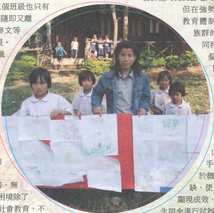
▲TOPS 和泰國教育部門合作，聘任甲良族青年擔任助理教師。