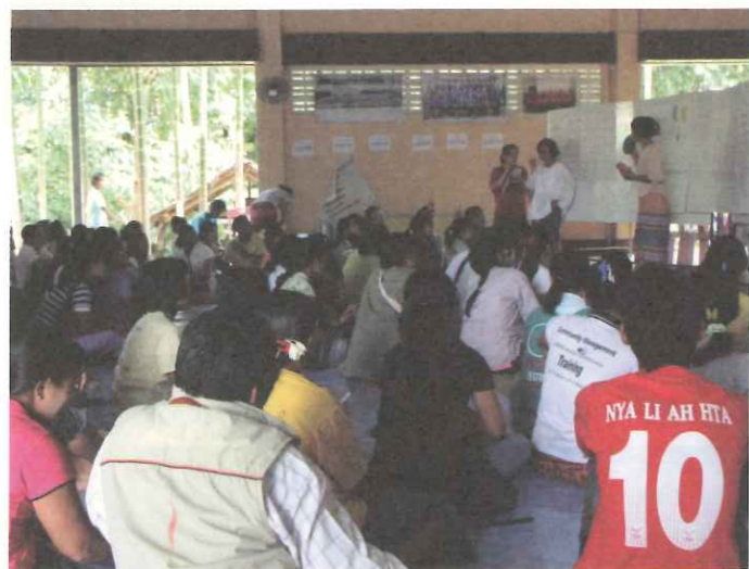
▲ TOPS 於 10 月初舉辦緬甸師訓，無論是學校或是教師數量皆創下新的紀錄。

TOPS 泰國工作隊於 10 月 7 日—9 日舉辦「緬甸移工學校幼教老師培訓坊」，這次的師資培訓課程，無論是 66 位教師的參加人數，以及 60 所緬甸貧童學校或緬甸社區幼兒園的參與，皆創下了新的紀錄。老師們多從邊境各地村落來參與，並有十多位老師從緬甸或搭車或步行，花上大半天的交通時間專程前來參加。