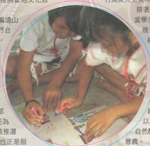
▲討論進行前學生僅能圖畫出部落家戶以簡易竹筒烹煮米酒的圖像。