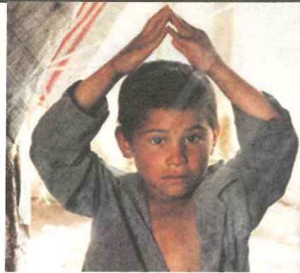
▲台灣應該正視國際社會的呼籲，共同保護與協助難民。

內政部於民國98年10月27日假入出國及移民署第一會議室舉辦「研修《難民法草案》」會議，邀請行政主管機關代表、民間團體代表以及專家學者共同針對《難民法草案》進行研議，期使相關法條規範更臻周延，本會由