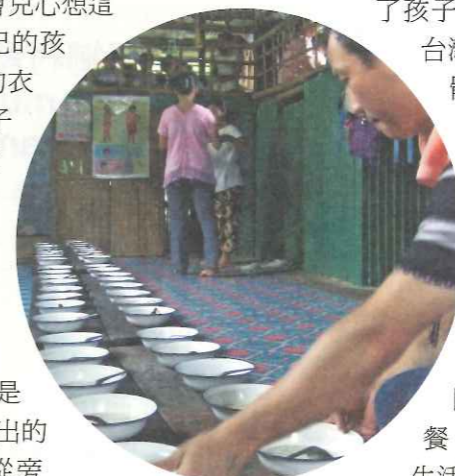
▲這一餐五泰銖的營養午餐，還攪拌著來自台灣的愛心捐助。

旁邊的老師上來和我說這個小女孩是屬於特殊教育的孩子，除了有營裡培訓出的特教老師輔導之外，還有孩子的家長從旁協助；轉頭看看家長，他和我的眼神交會了一秒便移開視線，而我似乎感覺到他眼神中透露出對孩子的心疼與憐惜。