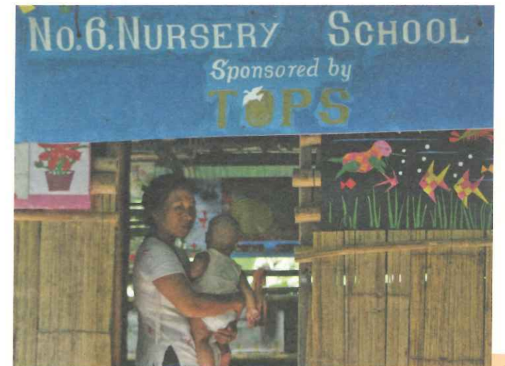
▲營內督導學習籌辦師訓及經驗分享，藉以累積能力和自信。