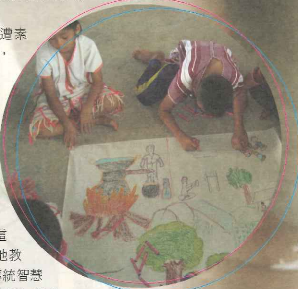
▲藉由分享和討論，學生們能夠繪製出整體傳統生活。