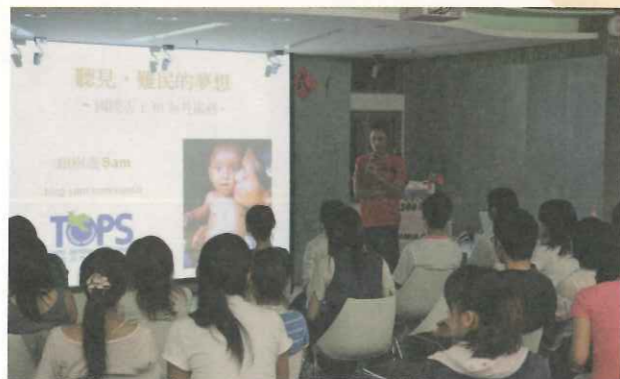
▲ TOPS 安排駐外同仁至各大專院校進行「聽見，難

UNHCR 在難民日前公佈的最新報告，截至 2008 年底，全球「難民 (Refugees)」和「境內流離失所者 (IDPs)」人數已高達 4200 萬，其中 1600 萬人