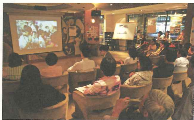
▲ TOPS 透過真實影像紀錄讓台灣社會更加理解難民。