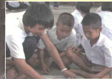
藉由參與 TOPS 教育服務計畫，彭逐漸累積起如何引領活動進行的經驗。