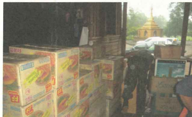
▲TOP 提供毛毯席墊、泡麵、食用罐頭以及防蚊液等民生必須物資。

民主派領袖翁山蘇姬，企圖將翁山以莫須有罪名判刑入獄，引起國際社會的憤怒和譴責，但軍政府長期踐踏人權自由，最終仍判決將翁山繼續監禁自宅一年半時間，至今仍有近兩千位政治犯未獲釋放。