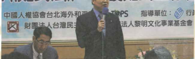
▲ TOPS 主辦「催生難民法座談會」並呼籲政府部門儘速完成立法。

而順利爭取國際地位與國際空間。TOPS 基於普世人權價值與人道精神，積極呼籲台灣政府部門，加速審理並通過此一法案，落實難民庇護制度，以行動承擔國際成員責任，捍衛普世人權。