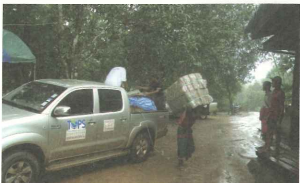
▲TOPS 泰國工作隊前往難民躲避區域，提供救援物資緊急發放。