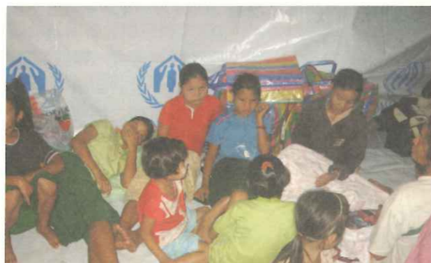
▲泰緬邊境新增大批難民，UNHCR 與國際組織共同合作協助安置。

長久以來，「甲良民族聯盟 (KNU)」因要求民族自決未獲緬甸中央政權重視，多次會談破裂，雙方自 1948 年後長期處於交戰狀態，並成為持續六十年之久的內戰。日前，緬甸軍政府不僅審訊