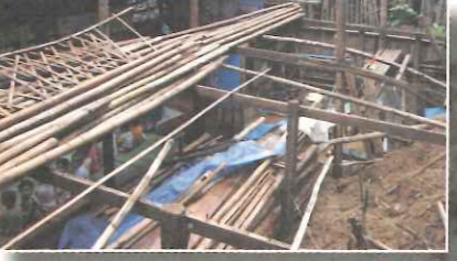
◀ 許多兒童學習用品及玩具遭受土石無情掩埋。