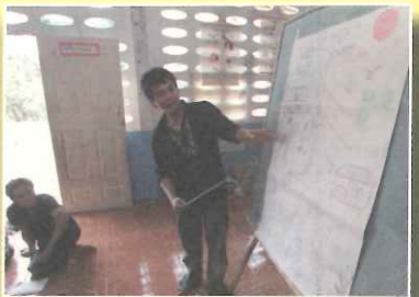
彭透過參與 TOPS 在地服務方案，逐漸體會厚植社區能量的意義。