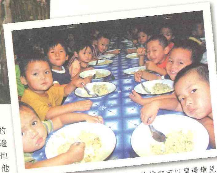
▲連科學麵也要七塊錢了，但五塊錢卻可以買邊境兒童一個有希望的未來。

些些努力（你可以點進去 TOPS 網站，有所有正在執行計畫的詳細說明），我知道每個人都很忙，都在為生活奔波，但難民營裡頭每個小孩只要五塊錢，就能有一頓午餐了，五塊錢，我們能買什麼？連科學麵也要七塊錢了，但五塊錢可以買他們的一個未來、一個希望、一個成長，如果你願意，請支持他們。