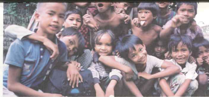
▲TOPS於柬埔寨建立學習資源中心並執行兒童教育工作。

為了因應柬埔寨亟需援助的情勢，TOPS於1996年在成立「柬埔寨工作隊」，結合在地社區與政府共同推動其戰後重建，進行遊民職訓、建立學習資源中心以及兒童教育等工作，希望透過在地教育的扎根，推動戰後社區的發