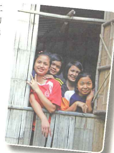
▲ 克倫部落青年在 TOPS 的支持下安心完成學業。

TOPS 工作團隊持續訪視各部落學校，實地瞭解當地需求，協助部落學校經營，並參與部落教師紀錄教案內容和學童的回饋；TOPS 也定期應邀參加公部門的下鄉訪視活動，除參與討論社區發展事務外，並贊助文具用品給偏遠村落學校。