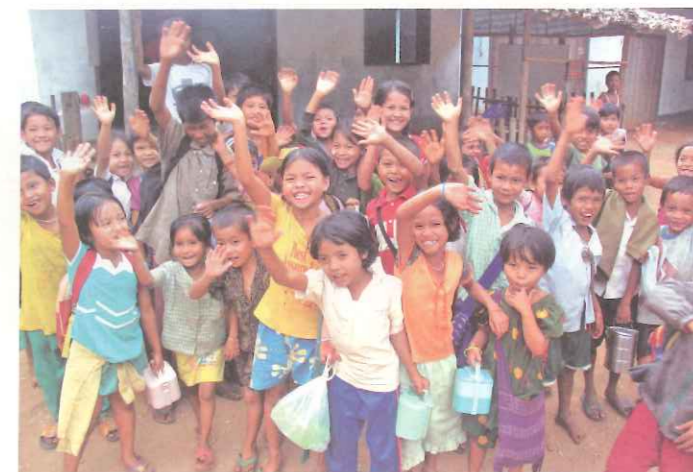
▲TOPS希望透過您我一點一滴的共同努力，讓世界變得更加美麗！