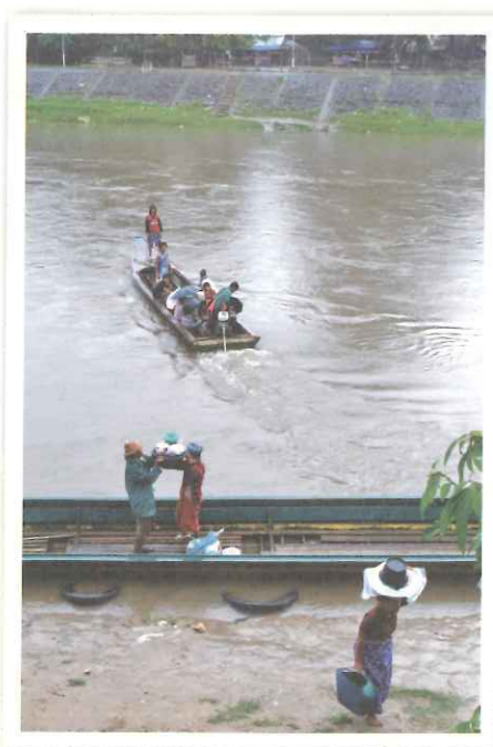
▲國界對他們來說，不過是一條河、一座橋，他們不過是走過來，生活，而已。

起飛之前，我很絕望，尤其是讀了越多的報導，越覺得我將前往一個「接近死亡墳場」的地方，從小我接受的教育說，「不自由吾寧死」，而我們這一代也的確一直在自由的環境中肆意亂竄變形，那麼理所當然的享受各種自由，甚至還偶爾抱怨自己因為社會規範約束而不自由（這也是一種言論自由啊！）；但在那裡卻活生生的有幾萬人一輩子得住在一個劃定疆域的地方，他們不能工作、沒有未來，直到死亡，這樣的生命價值何在？