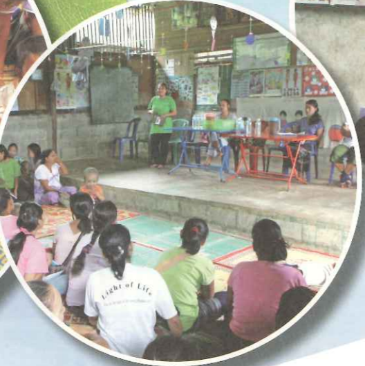
▼ TOPS 於學期末召開家長與教師座談會。