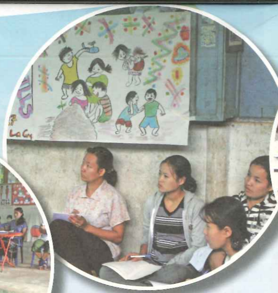
▲ TOPS 巡迴三座難民營區舉辦教師培訓工作坊。