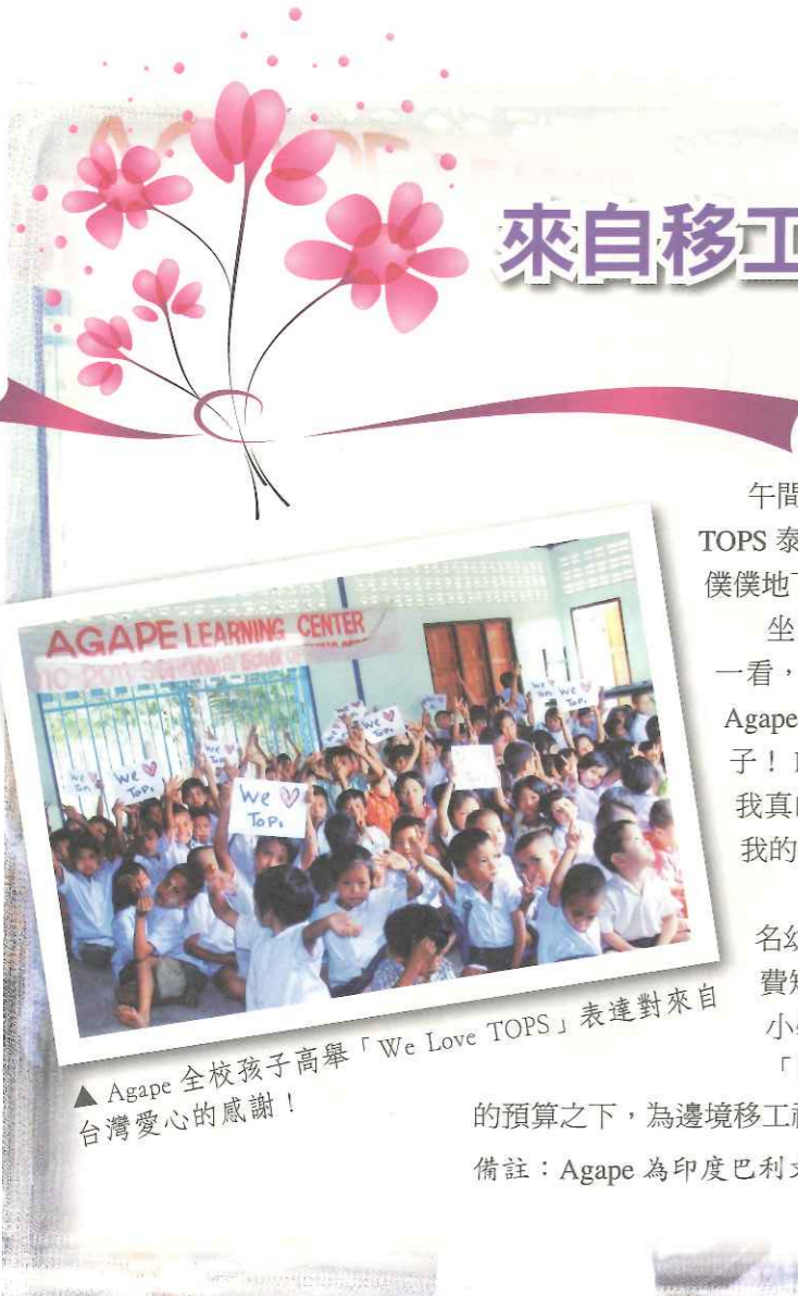
▲Agape 全校孩子高舉「We Love TOPS」表達對來自台灣愛心的感謝！