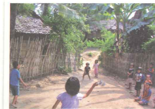
▲營裡的彎延小徑就是孩子們遊戲的場所，編織著成長的回憶。

「因為有他們（難民、移工），我才有機會來到這裡，不要說是在幫助他們，說幫助感覺好像我們比較優越，如果沒有他們哪有我的存在，應該是我謝謝他