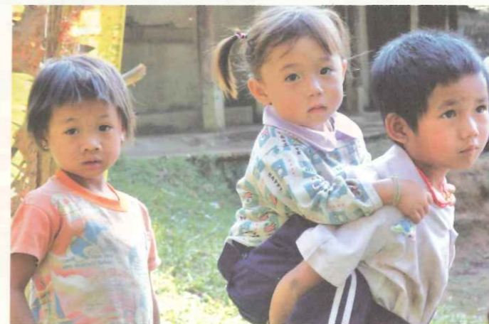
▲ TOPS 希望透過難民日活動，讓台灣大眾了解全球難民概況與生存處境。

世界上每不到 140 人中就有一人是難民，這些尚不包含因為自然災變而產生的環境難民。這些難民都是國際社會所應該關注與援助的對象，雖然 UNHCR 和眾多國際組織已竭盡所能，但仍不能有效滿足難民的許多基本需求，難民們普遍面臨缺乏營養、飲水和基本醫療的困境。