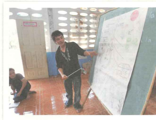
▲彭透過參與 TOPS 在地服務方案，逐漸體會厚植社區能量的意義。

「現在，我能夠堅定地對別人說出，我是克倫族人，我來自山林裡的克倫部落。這不再讓我感到自卑，不再覺得自己比人家差。」