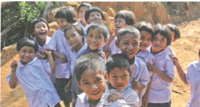
▲ 移工學校提供孩子一個讀書的環境，免於遊蕩街頭、淪為人口販賣對象。

TOPS 與 BMWEC 合作，評估與執行急難協助經費之運用，由 TOPS 提供小額經費，補助學校之特別支出或其經費短點之部分，例如：水電費用、校地租金、孩童醫療補助等，將視項目及需求而定。