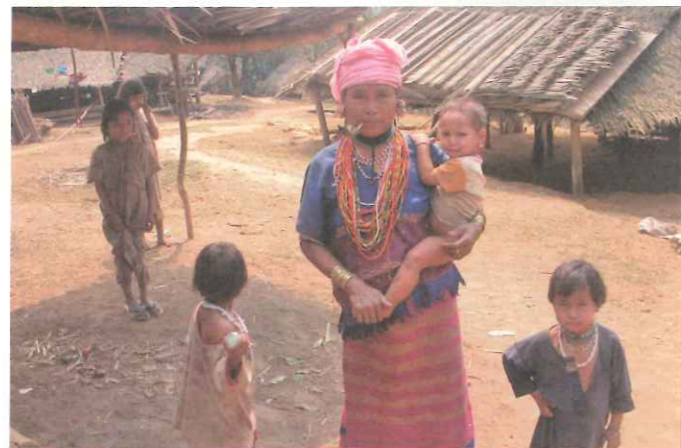
▲ 泰國偏遠克倫部落資源匱乏，面臨永續發展困境。