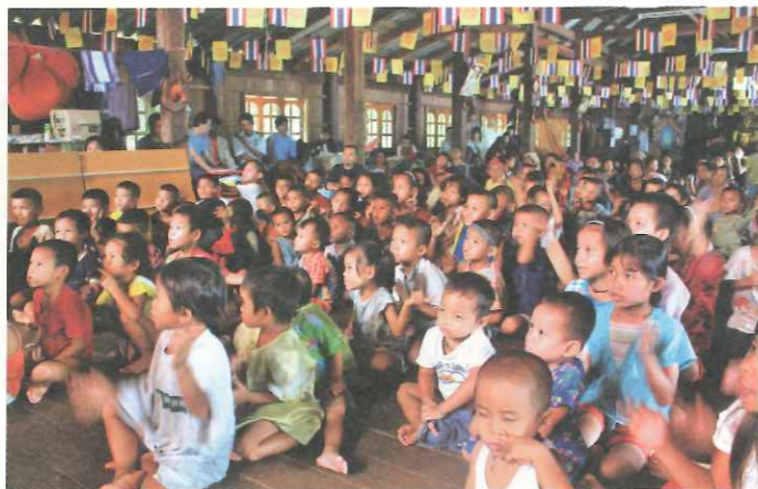
▲ TOPS 為三座難民營內 4000 名孩童提供良好成長與學習環境。

聯合國難民署積極尋求民間團體與非政府組織（NGOs）成為工作夥伴，共同致力於協助難民；NGOs 之獨特性使其往往能於緊急事件中迅速評估、整合並提供服務。TOPS 參與協助泰緬邊境地區難民援助，也與各國際機構協力合作，積極參與國際難民服務事務。透過關懷與尊重的互動，學習不同文化的價值與生活態度，進而反省台灣自身的發展方向和步調，才能讓台灣進入全球公民社會領域貢獻己力。