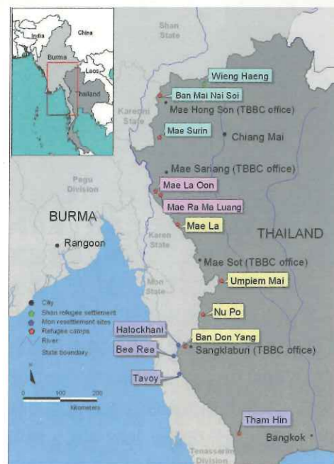
▲ 泰緬邊境九座難民營，共收容逾 15 萬緬甸難民。

1980年代起，由於緬甸軍政府高壓統治，對少數民族採取強徵勞役、強迫遷村、行動管制，並打壓其文化與宗教信仰，超過 250 萬難民被迫離開家園，湧入泰國尋求生存。