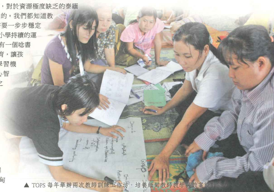
▲ TOPS 每年舉辦兩次教師訓練工作坊，培養緬甸教師教學與教案設計能力。

文化與弱勢民族發展的課程。透過教學觀摩與機構參訪等方式，增進緬甸教師們的傳統文化知識，進而將民族文化融入教學中。我們希望讓孩童們在學習新語言與新文化的同時，仍然得以發展出自我肯定的態度，以及建基於傳統文化上的民族意識和生活智慧，將民族的豐富經驗透過正式與非正式的教育管道繼續傳承至下一代，建立起在未來得以永續發展的基礎。