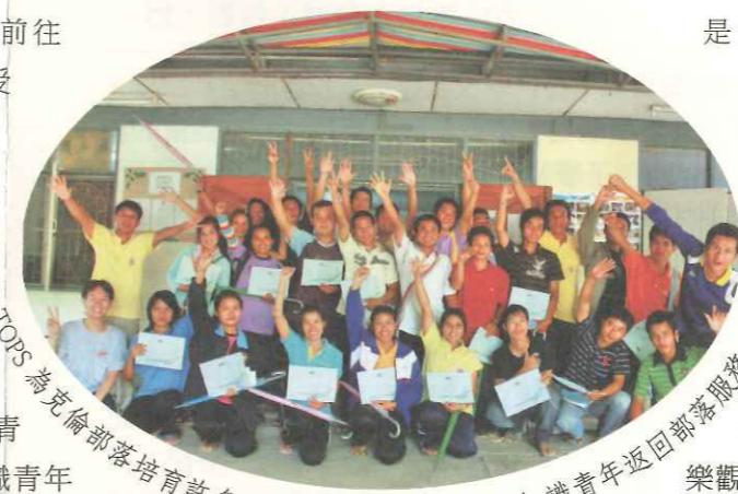
TOPS 為克倫部落培育許多高等教育青年，並鼓勵知識青年返回部落服務。

其實，「上學」才該是被放大的重點，應該嘗試去縮小那許多的不盡人意，換個想法與念頭並不難化解這樣的鑽牛角尖。克倫人那樸實自然不做作的天性，才是最可愛也最難能可貴的。Fon 還有其他的克倫青少年，