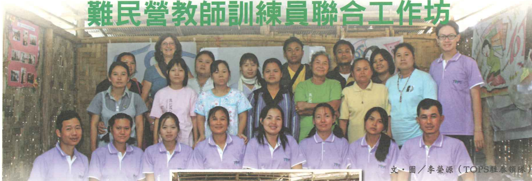
文·圖 / 李榮源 (TOPS 駐泰領隊)