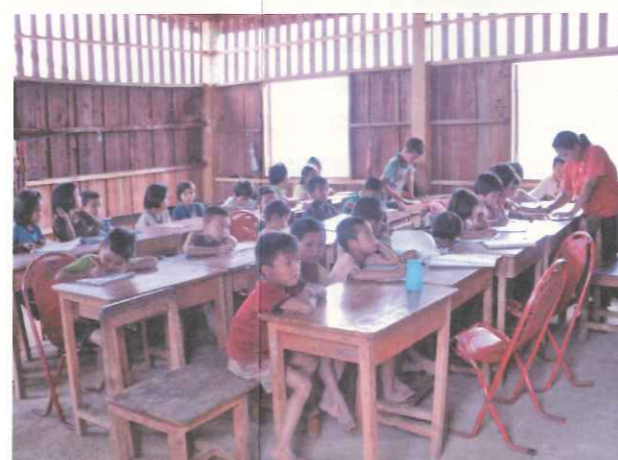
▲ TOPS 協助 10 座偏遠部落成立公立小學分校。

• 提供師資在職訓練或進修：TOPS 於寒暑假、暑假各舉辦為期一週之「部落教師訓練工作坊」，內容包括鄉土教案設計、學校經營、社區服務、健康教育，以及文化研習