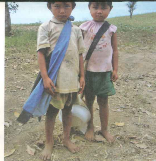
▲ 部落小朋友光著腳丫子跋涉也不減上學的熱誠。

作人員定期巡視教學狀況和克倫教師的駐村教學，也得以瞭解部落之實際需求，採取社區參與方式推動各部落社區發展工作。