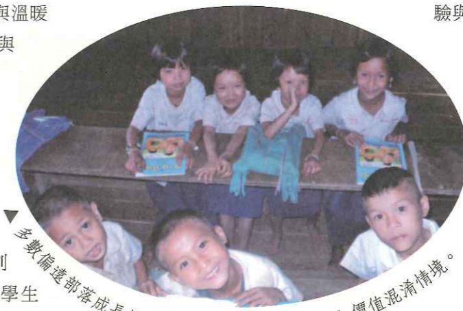
多數偏遠部落成長的孩子，進入城市後總會陷入價值混淆情境。