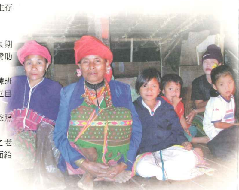
▲ TOPS 與 KWO 合作，為難民營內老弱族群提供社會性照護與服務

培養營內安全之家社工人員知識與技能，導入 KWO 的共同參與不但有助於 TOPS 社會服務計畫的執行，更可以使服務落實於社區。TOPS 透過在地婦女之間的相互合作，形成團體支持系統，在計畫參與過程中逐漸學習自行規劃與執行方案的能力，協助 KWO 成員建構計畫管理、社會服務與團體運作等能力。