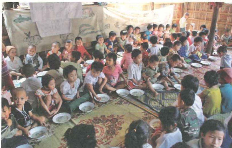
▲ TOPS 所提供學校午餐為眾多難民幼童提供成長所需營養。