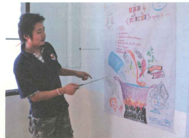
▲ TOPS 獎助部落青年接受高等教育，並於學成後返鄉服務。