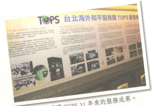
▲ 會場海報呈現 TOPS 31 年來的服務成果。