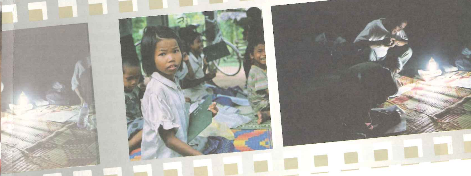
▲(柬埔寨照片, 2004 年)