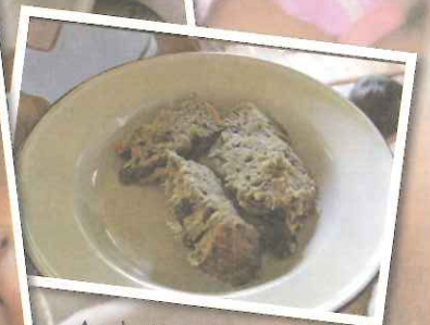
▲ 加入砂糖、雞蛋、食用油，有時和著香蕉，蒸出味道迷人的 AsiaMIX 點心。