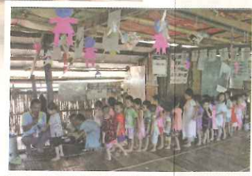
▲ TOPS 教導幼兒良好衛生觀念，於用餐前排隊洗手。

製作不同類型之點心。AsiaMIX 是一種米黃色粉狀的營養補充品，是由負責難民營糧食與房舍的國際組織「泰緬邊境聯合會 (Thailand Burma Border Consortium, TBBC)」，提供給泰緬邊境上九座難民營中所有的幼兒園，作為營養補充之添加物。AsiaMIX 含有多種維生素與礦物質，例如：維生素 A、B 群以及 D，同時也包括少