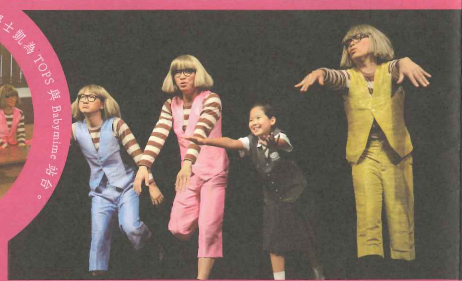
大愛電視台的「小主播」前來採訪，與默劇團開心互動。