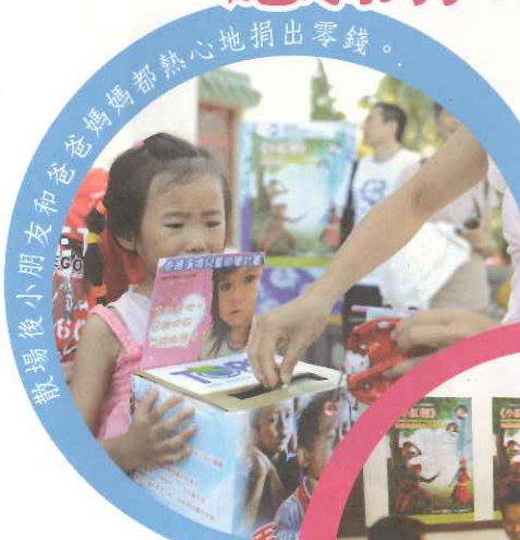
歡場後小朋友和爸爸媽媽都熱心地捐出零錢。