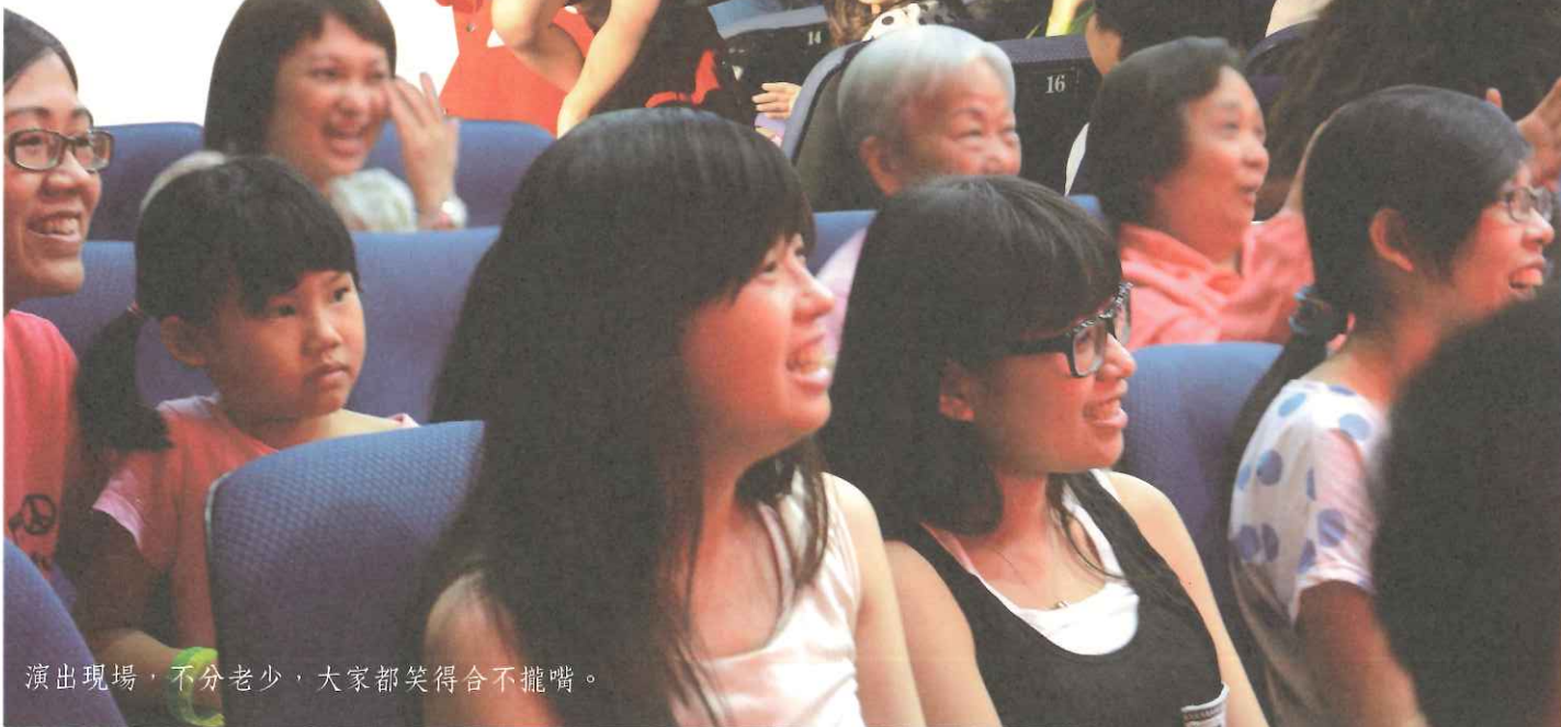
演出現場，不分老少，大家都笑得合不攏嘴。

主題劇碼《小紅帽》以生動活潑的肢體表達與豐富而無厘頭的情節橋段，在家喻戶曉的童話故事中，為所有角色賦予新的詮釋，一改大家對可惡大野狼、柔弱小紅帽的刻板印象。Babymime 的泰式幽默讓全場驚喜不斷、笑聲連連；許多觀眾在散場後仍依依不捨，紛紛排隊與小紅帽、大野狼和老奶奶簽名、合照，為這一天留下美好回憶。小朋友都說，很高興可以看到小紅帽；一位媽媽也覺得印象深刻，因為他們「沒有說話，只有用肢體語言表達，可是就可以讓這麼小的小朋友能夠知道他們在表演什麼東西，然後一起得到共鳴！」年輕朋友們更是直說：「好久沒有這麼放鬆地開心大笑了！」