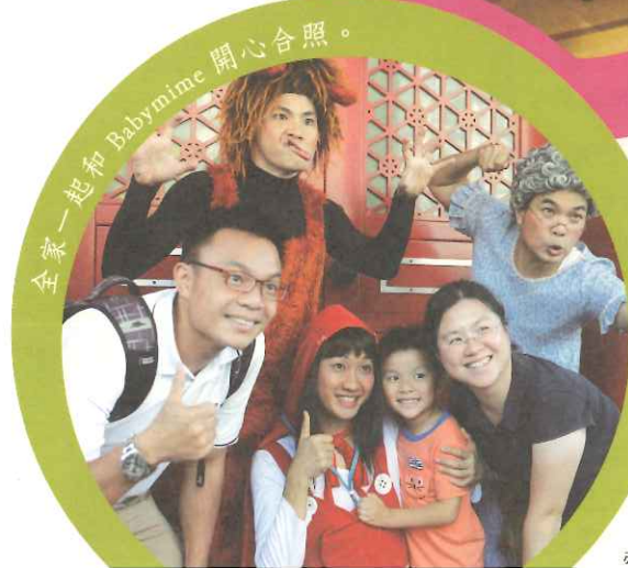
全家一起和 Babymime 開心合照。