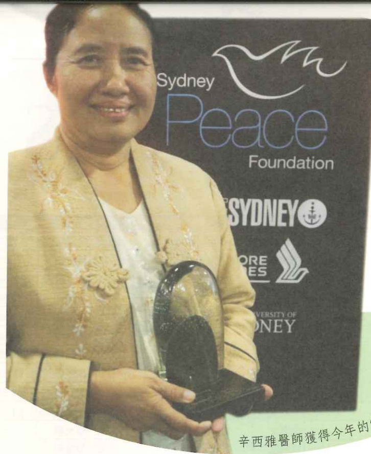
辛西雅醫師獲得今年的雪梨和平獎。

雖然兒童的糧食配給份量不在這次調整計畫的範圍內，但是家中大人所分配到的米糧減少了，孩子們難保不受影響；為了確保難民孩童在家裡所分配到的米糧之外，能攝取到更充分的營養，保障孩子們的成長發育、奠定良好的健康基礎，TOPS 在難民營幼兒園中所提供、有新鮮肉類及蔬菜的營養午餐，也就更形重要了！