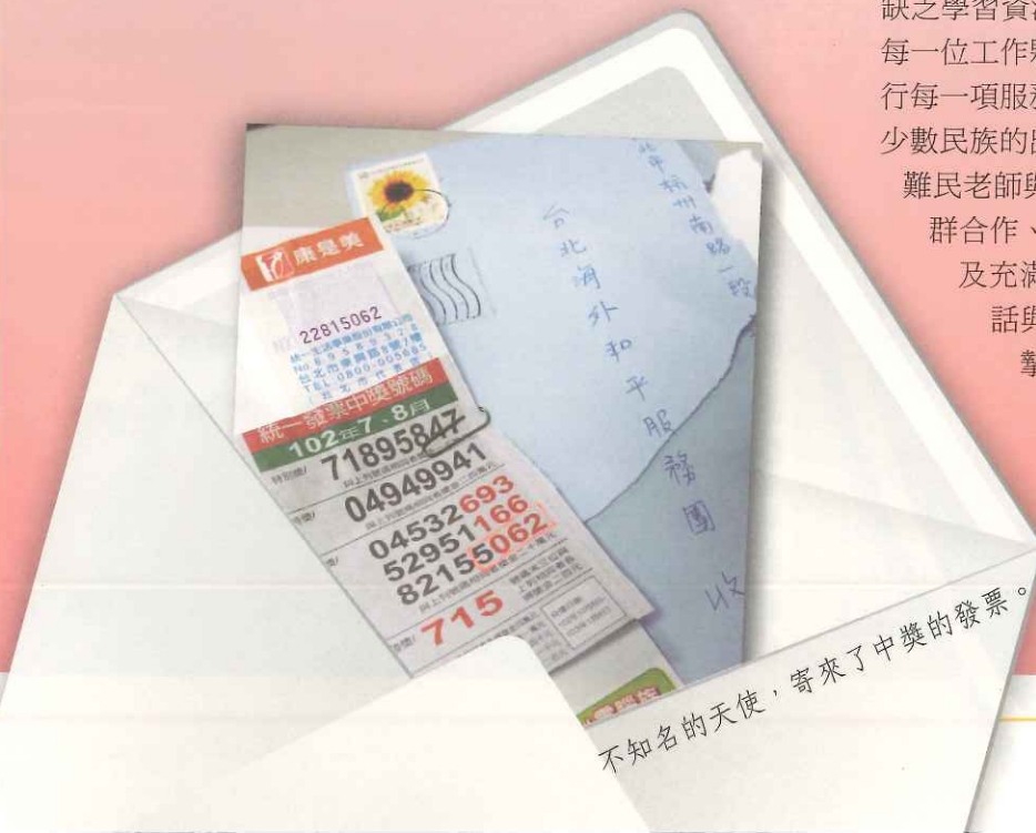
不知名的天使，寄來了中獎的發票。