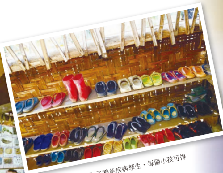
▲雨季到來，為了避免疾病學生，每個小孩可得脫了鞋才能進到教室來。

不到二十坪大空間，得同時容納5個班級。不同的班級只能以塑膠布幕單區隔。上一課5個班級、5位老師，