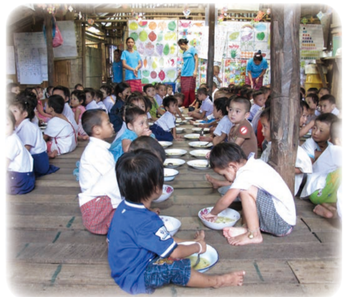
▲ TOPS 提供的營養午餐