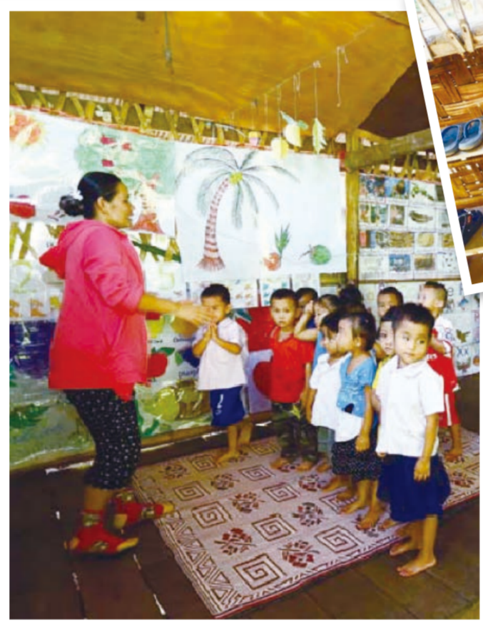
▲布幕拉起，就是一間教室。不到二十坪，利用木頭竹材搭建的高架屋教室，容納了五個班級。

而少數的難民則受雇於國際NGO組織賺取些許補貼或在營內經營小生意。但對多數難民而言，沒有身分意味無法外出工作，只能無所事事度過每一天，日常的一切所需，全賴國際組織的奧援。