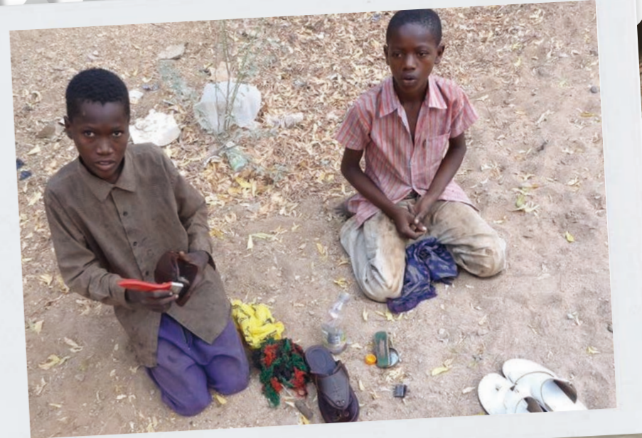
▲ 加法爾 (右) 以及他的朋友在達達阿布難民營修補鞋子。

* 為保護當事人隱私，故事人名為化名。 原文來源: Refugee International