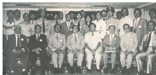
杭理事長與得獎人合影

本會與中華民國團結自強協會及中央日報聯合舉辦的「推行社會守法風紀徵文活動」，於10月27日在本會會議室舉行頒獎典禮。