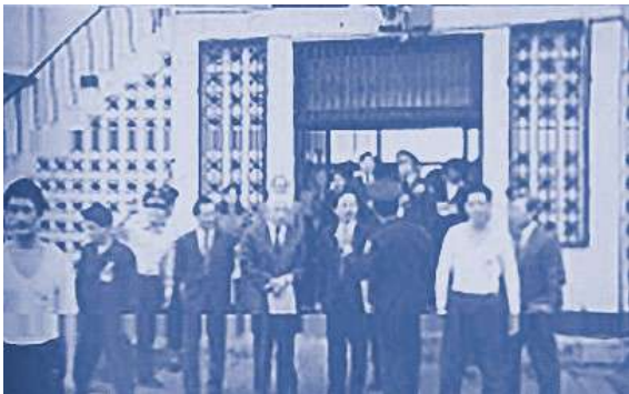
本會訪問團訪問新竹處理中心

本會為關切大陸偷渡客經我政府收容，等待遣返前之待遇情況，於 4 月 16 日組團前往新竹處理中心訪問考察。