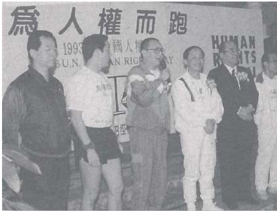
參加貴賓：左起王應傑、馬英九、詹裕仁、高育仁、吳伯雄、陳廷棟、柏楊、徐培寶。