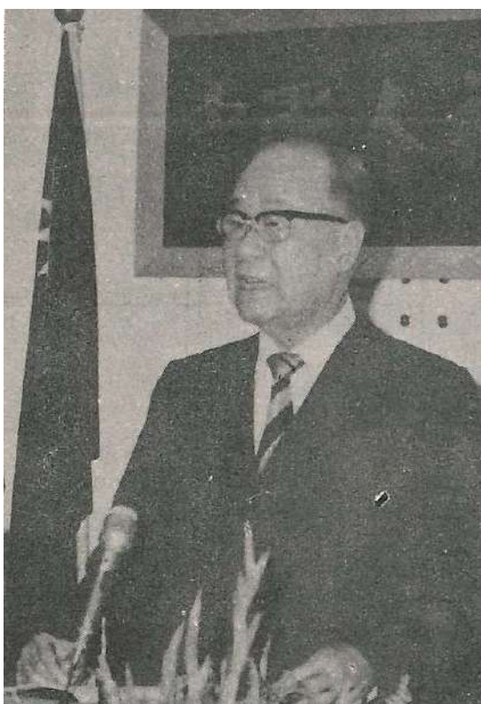
謝副總統應邀發表訓詞

中國人權協會民國 70 年度全體會員大會，定 4 月 25 日下午假臺北市衡陽路 100 號 7 樓，本會會議室舉行，由杭理事長擔任主席。謝副總統應邀發表訓詞。內政部次長易君博亦將應邀講話。本次年會除作會務報告外，並將選舉