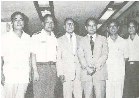
杭理事長（左三）與反共義士合影於聲援義歸委員會成立大會

中國人權協會為聲援反共義士來歸，並促使國際人士瞭解大陸人民爭取自由之心願，特於 8 月 16 日下午在本會會議室成立「聲援義歸委員會」。