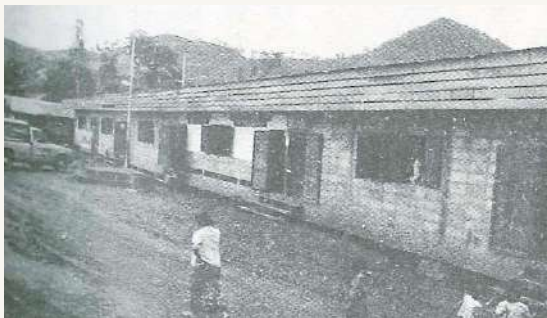
班維乃難民營外貌

班維乃 (Banvinai) 難民營 泰國境內最早成立的中南半島 (印支) 難民營之一，在 1975 年 12 月開放，專門收容渡過湄公河逃入泰國境內的寮國難民。1979 年寮國難民增加，泰國政府乃將高地苗人與低地寮人分開，班維乃營專門收容高地苗人，寮國人則移至那空柏儂 (那坡)、班南徭兩營，現班維乃營所收容之高地人已達 44000 人，而成爲考依蘭難民營之後的東南亞最大的難民營。