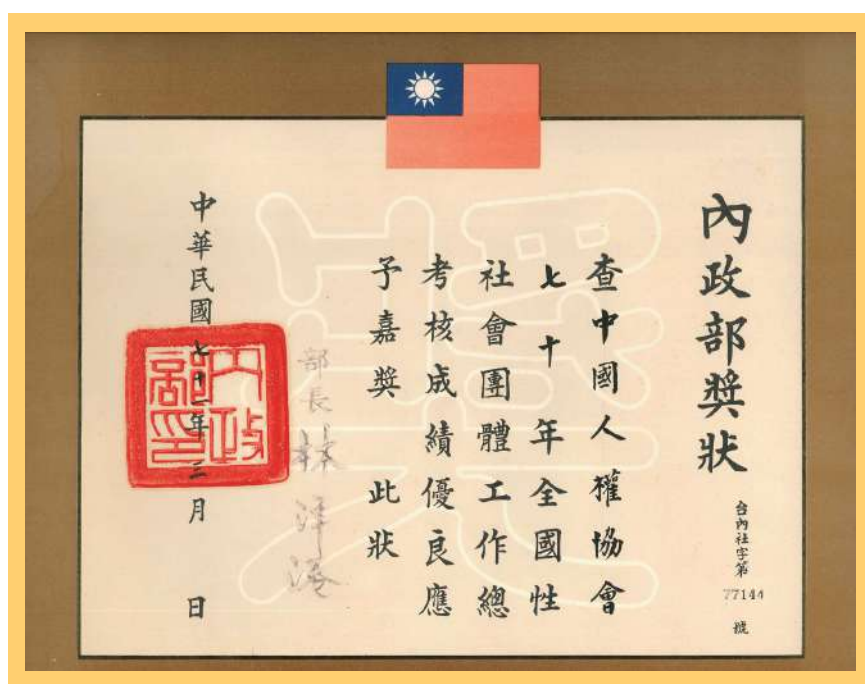
本會獲頒全國社團績優獎

民國 70 年度全國性社會團體工作總考核，本會成績優良，獲內政部嘉獎。頒獎大會於本 71 年 3 月 24 日下午假內政部大禮堂舉行，由林部長洋港親自頒發獎狀。