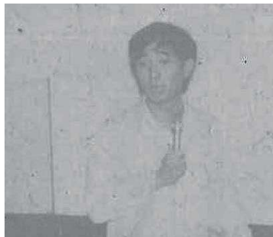
中泰服務團團長對支援難民服務作一簡介

《大難呼聲》一書係本會中泰支援難民服務團於泰境難民營之十三年工作紀實，由本會編輯出版，由聯經出版社總經銷。金石堂並為該書舉行義賣，所得全部捐贈本會作為救助泰境難民的經費。