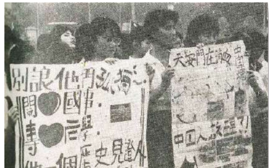
參與學生同感悲憤

本會為聲援大陸民主運動並悼念為中共鎮壓下所死難之學生與一般民眾，特聯合中華民國退伍軍人協會、中華民國團結自強協會、中華民國消費者文教基金會、陽光文教基金會、