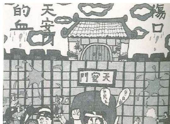
啓智學校學生的作品