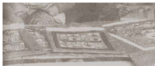
帕那尼空營難胞婦女製作手工藝品

學校教職員之薪資係以工代賑性質，泰國政府規定不得發放現金，幾經折衝改為一半現金一半實物。但工作人員仍爭取發放現金。據瞭解，營內照顧幼年難民組織，在聯合國同意下以現金發薪。故將繼續協調改進。另華聯會針織班及美髮班之存廢正檢討中。