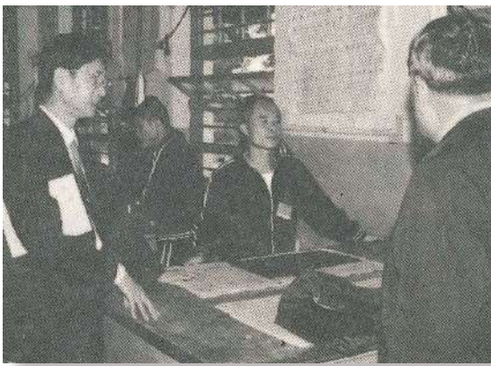
監獄管理人員之不足是臺灣獄政最大的隱憂

本會關心受刑人的人權問題，鑑於監獄行刑最主要目的，在求對受刑人施以矯治教化，學習一技之長；且受刑人的人權應該加以尊重、不應抱持「犯罪者沒有人權」的心態，剝奪犯罪者做為一個「人」應有的權利。