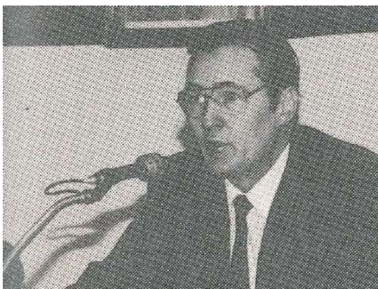
康氏呼籲我國政府協助藏胞爭取人權