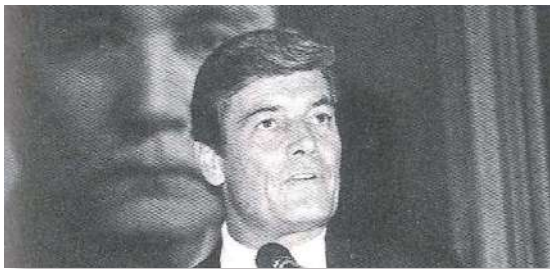
克蘭眾議員在人權日紀念大會中演說

本會為紀念 72 年世界人權日，於 12 月 9 日下午假中山堂中正廳舉行紀念大會。大會由杭理事長親自主持，行政院副院長邱創煥應邀蒞會致辭，美國眾議員克蘭發表專題演講，反共義士孫天勤、王學成亦在會中演說。出席大會者包括本會會員及各界人士近二千人。