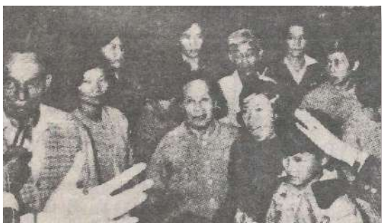
圖為重返祖國的 23 名難僑

23 名由高棉逃至泰國的華裔難民，在中國人權協會的協助下，於 3 月 10 日晚間由曼谷搭華航班機返回祖國。