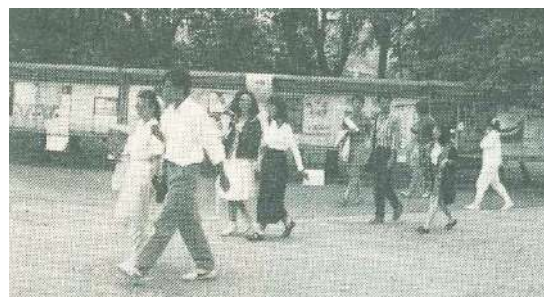
隨著人權意識之高漲，人權教育已逐漸在校園中落實

推廣人權教育乃本會今年度的工作重點，希望藉今年度的人權盃大專辯論賽、人權講習會與校園巡迴演講等活動使這項工作能落實。