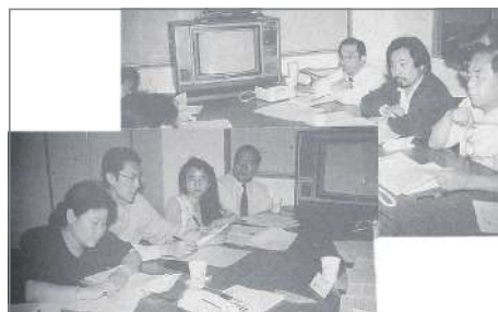
本會盡可能的提供協助與採取行動

聯合國人權中心則於 4 月 28 日回函給本會高理事長。信中說該中心根據正常的處理程序將送請相關國家要求注意此案，另外並將提交人權委員會及「少數民族保障暨防止歧視小組委員會」審議。