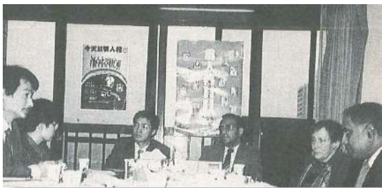
亞太地區人權組織委員會

本會為進一步推動去（79）年 10 月 2 日至 4 日在臺北召開之「亞太地區人權組織研討會」之決議：籌組「亞太地區人權組織聯盟」及「亞太地區人權組織資訊中心」等工作重點，再於本（80）年 4 月 30 日至 5 月 3 日邀集該次會議推選之澳大利亞、馬來西亞、菲律賓、斯里蘭卡及中華民國等代表，組成 5 人委員會，舉行「亞太地區人權組織委員會」。