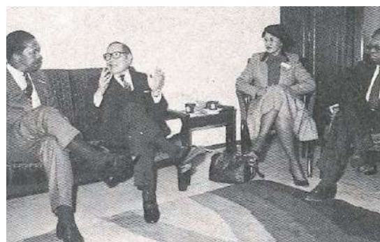
美國黑人民權領袖訪問本會

美國黑人民權領袖訪華團一行 6 人，由「全美都市聯盟」主席賈可布 (John Jacob) 率領，應本會邀請於 2 月 5 日至 10 日訪華，並於 2 月 6 日中午抵達本會拜會。