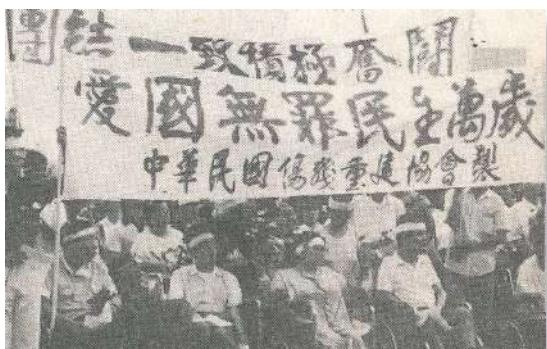
殘障同胞也表達了至深的哀悼

伊甸殘障基金會、主婦聯盟、演員工會、董氏基金會等三十餘個民間團體，於6月7日下午在國父紀念館舉辦「天安門死難同胞追悼會」，發表共同聲明，譴責中共武力鎮壓的暴行，與會各團體皆表示全民對為爭自由民主而犧牲的愛國志士至深的哀悼，以及對未來大陸民主運動的堅定支持。