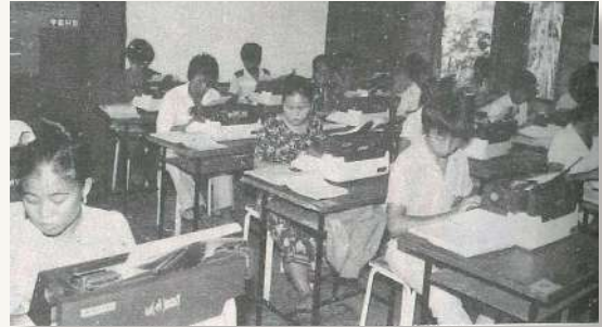
難民營打字班上課情形

聯合國對難民問題的解決方針有三：(1) 志願遣返，(2) 就地安置，(3) 移居第三國。苗族生活簡單，對於現代物質生活並無認識；